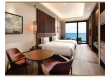
아난티 옛 부산 코브 오션뷰 디럭스 트윈