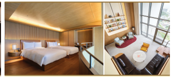
아난티 옛 부산 빌라주 오션뷰 복층 캐빈